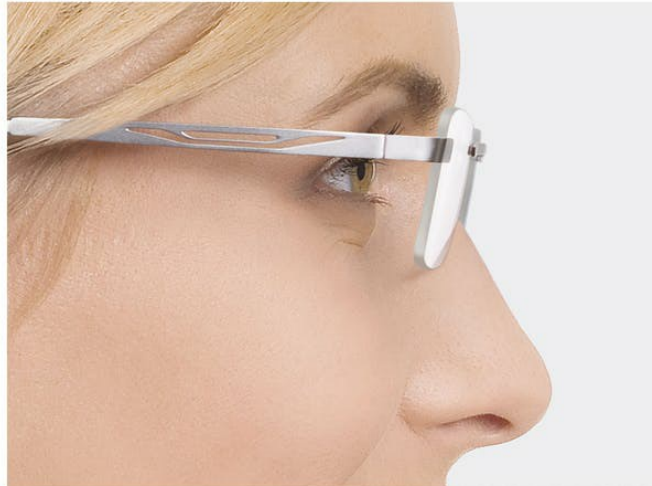
最新の高屈折率物質で小型のメガネが可能に

もちろん厚すぎるレンズをどうにかするためにもできることがあります。最新の高屈折率物質を使った薄型でファッションブルなレンズ > (高指標) は、強度の視力矯正が必要な女性にもナチュラルなルックスを実現します。