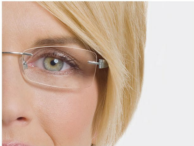
見栄えの悪い極小効果

近視用メガネをかけている女性は、まさに正反対の悩みを抱えています。残念なことに、メガネが彼女たちの目を小さく見せるのです。そのため、近視の女性は暗い色のアイシャドーや濃いアイライナーを避けるべきです。明るい色の、キラキラ光るローズ、ラベンダー、ベージュ、ライトグレーまたはホワイトを選んでください。