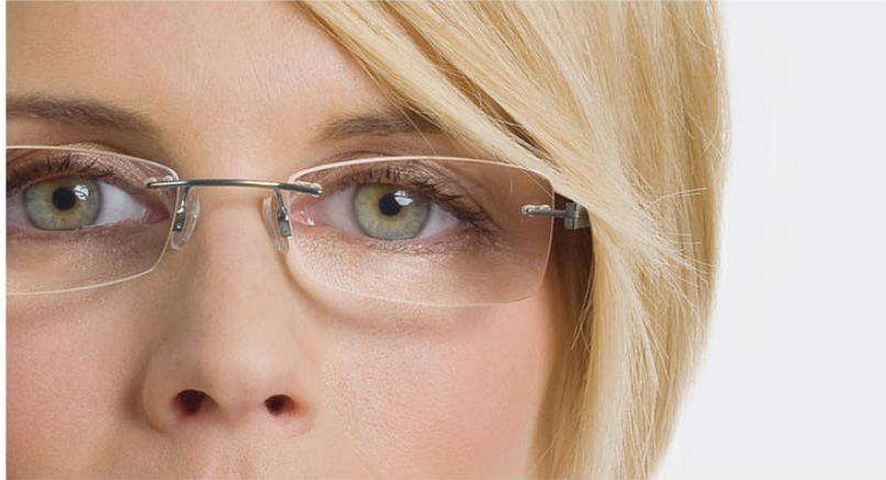
見栄えの悪い目効果

目の内側から目尻に向かって、まぶたのひだからはみ出さないようにアイシャドーをつけます。暗い色のアイライナーかアイペンシルで、まぶたの縁を強調します。これはあなたの目を小さく見せる効果があります。メイクはすべて慎重にしてください。レンズによって目が大きく見えますから、メイクの失敗もより目立ってしまうからです。上まつ毛にマスカラをつけすぎないように、下まつ毛にはマスカラはつけないかまたはほんの少しだけつけるようにしてください。