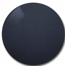
Color: Grey pol 85%