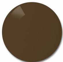
Color: Brown pol 85%